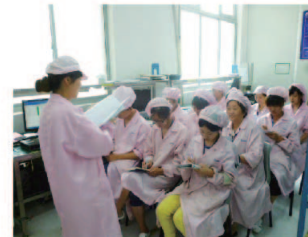
图为：现场质量培训

操作规范的自觉性，为提高产品质量提供了有利保障。对活动中涌现出的典型个人和事迹予以表彰，努力营造良好的氛围。