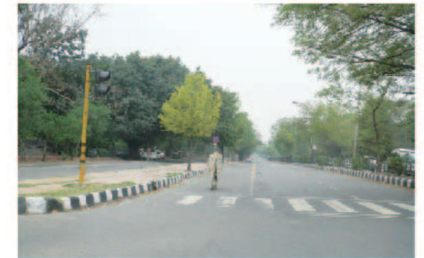
牛儿带我们向前走

在我去过的大小十多个国家中，去的比较多也是印象比较深刻的有4个地方，incredible印度，美丽富饶之宝岛台湾，精致的岛国日本和自由粗犷的伟大国家-美国。这里和大家分享一些incredible印度的见闻。 我的SIMCom之旅是从印度开始的。2008年9月，扛着10包方便面和老干妈就出发了；飞机上和FAE老大哥聊着他在印度的革命家史：不能喝生水，煮方便面也要用瓶装水，小旅馆的黑心棉被子，和代理商FAE挤一张床，令人崩溃的网速，健谈的印度客户，印度餐馆的蔬菜汤很好喝，炒饭和炒面也不错…。刚下飞机，扑面而来的就是这个古老的国家的贫困和落后，空气中弥漫着有机肥的气味。随后和其他头次到印度的人一样：举起手中的相机，拍下没有门的公车，火车，贫民小窝棚，满街散步的长着驼峰的牛，爆炸头的黑脸乞丐以及瘦小的狗和椰子。每每回忆起来，总能想到老子的道家文化：据说老子是印度人哦…。