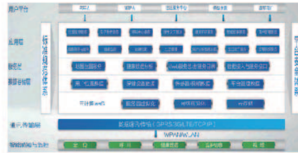
为老云平台技术架构

它是一种通过Internet提供软件的模式，用户无需购买软件，而是向提供商租用基于Web的软件，来管理企业经营活动。例如晨讯科技正在研发的为老云，提供网络智能化的养老SaaS服务，包括健康档案、健康数据管理、智能家居、家政服务与远程视频咨询等。